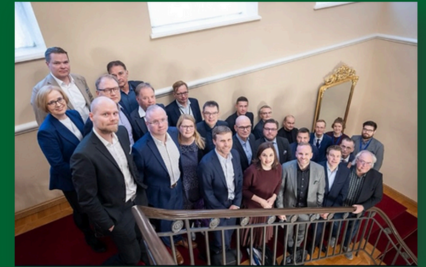
Kuva: 15.10.2025 Ministereiden Sanni Grahn-Laasosen & Mika Poutalan pyöreän pöydän keskustelu

Julkaistu 13.10.2025 fpafinland.instagram