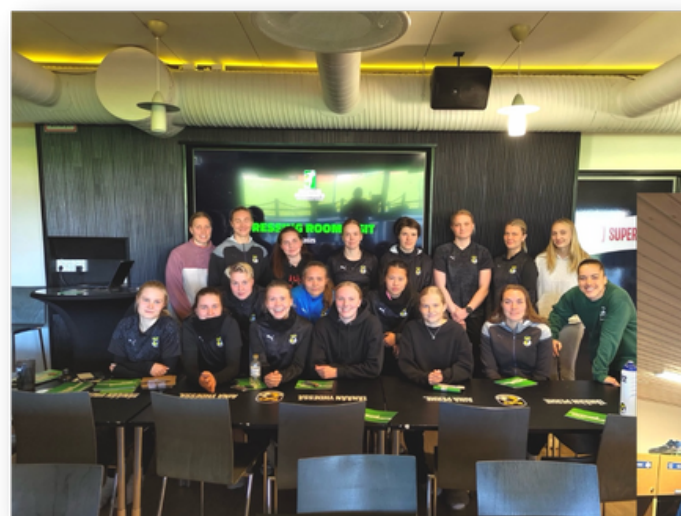
KuPS naiset 1.4.2025